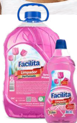
FLORES DA PRIMAVERA