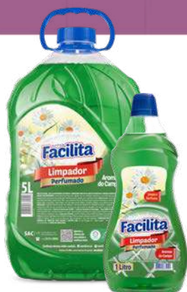
AROMAS DO CAMPO