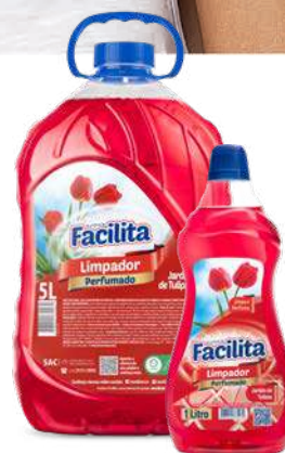
JARDIM DE TULIPAS