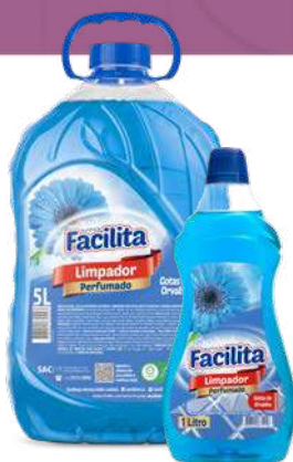
GOTAS DE ORVALHO